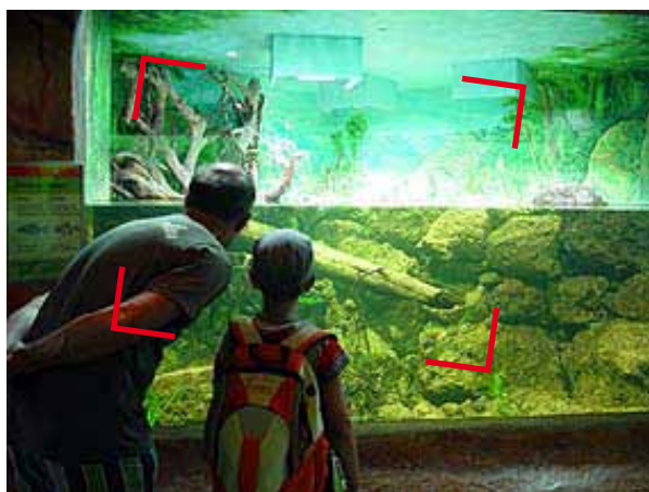
Einblick in die faszinierende Unterwasserwelt am Flusssufer.

Das neu gestaltete Aquarium im Natur- und Tierpark Goldau zeigt die faszinierende Welt unserer Flusssufer. Mit Wurzeln und Steinen aus der Region wurde eine authentische Unterwasserwelt geschaffen. Dank genügend Licht gedeihen jetzt Pflanzen, wie sie in einem solchen Habitat vorkommen. Eine Pumpe sorgt für die nötige Strömung. Bereits sind die ersten einheimischen Flussfische eingezogen: Laube, Erlitze, Groppe und Nase können durch die grosse Scheibe in ihrem Verhalten beobachtet werden. Im Herbst und im kommenden Frühling werden weitere Arten folgen. Es ist tierisch was los!