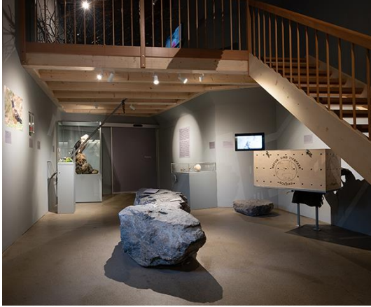
Die neue Bartgeier-Ausstellung wurde heute eröffnet.