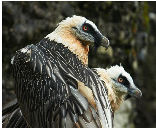
Zwei Bartgeier im Natur- und Tierpark Goldau.