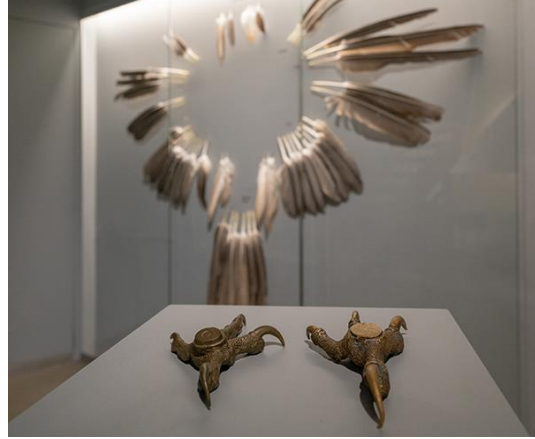
Die Ausstellung besteht aus vielen Unikaten, wie der über die Jahre gesammelten Federn.