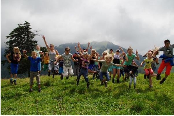
Am Puls der Natur – die Kinder im Tierpark-Lager