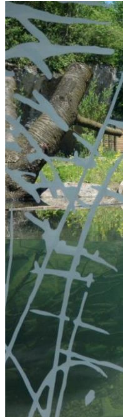
Blick in die Fischotteranlage

Betrachte nun die Einzäunung: Durch den Zaun in der Mitte kann die Anlage in zwei Gehege unterteilt werden. Wieso ist das wichtig?