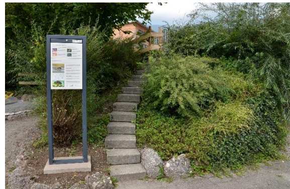
Blickfang: Hier leben Efeu-Seidenbienen.

Der Natur- und Tierpark Goldau wurde 1925 gegründet. Er beherbergt auf 42 Hektaren rund 100 Tierarten. Als wissenschaftlich geführter Tierpark setzt er sich für die Aufzucht und Wiederansiedlung der vom Aussterben bedrohten Tierarten ein. Der Tierpark Goldau beschäftigt 62 Vollzeit-Mitarbeitende und während der Saison bis zu 154 Personen. Er ist seit 2005 als gemeinnütziges Unternehmen ZEWO-zertifiziert. Das Gütesiegel zeichnet vertrauenswürdige Institutionen aus. Es steht für einen zweckbestimmten und effizienten Einsatz der finanziellen Mittel.