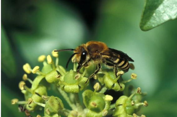
Die Efeu-Seidenbiene, Colletes hederæ