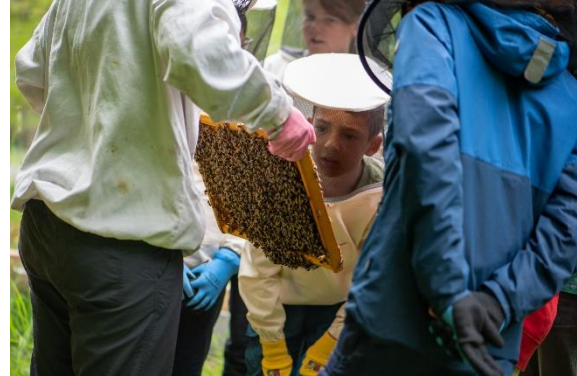
Insekten entdecken: Schüler erforschen Honigbienen.