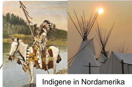
Indigene in Nordamerika

Eulen stehen in der Hieroglyphenschrift für den Buchstaben «M»