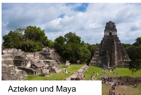
Azteken und Maya